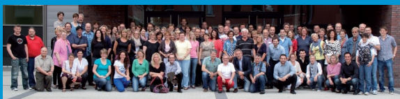
Kollegium des LBK