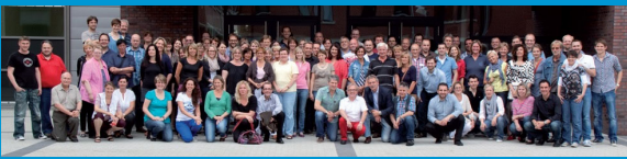
Kollegium des LBK